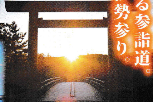
伊勢神宮(イメージ)